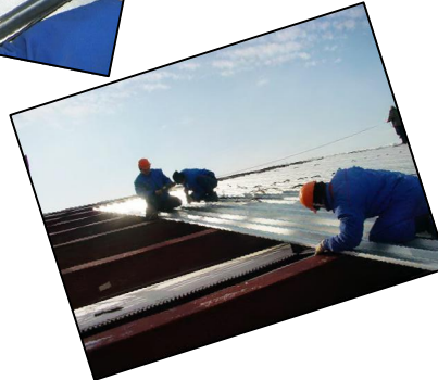
«ՏԵԽՇԻՆ» ՍՊԸ 2015թ.